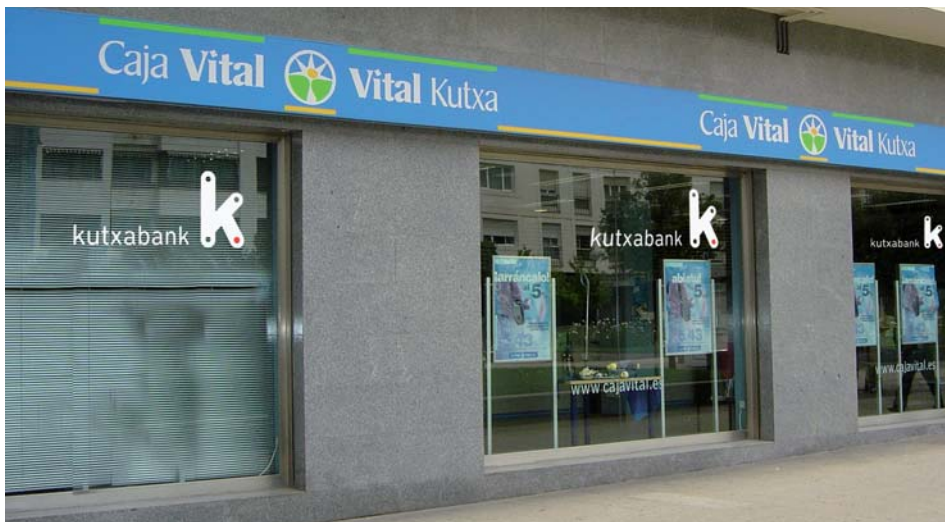
Kutxaren bulegoek markari eutsiko diote Araban, baina irudi berria erantsiko dute